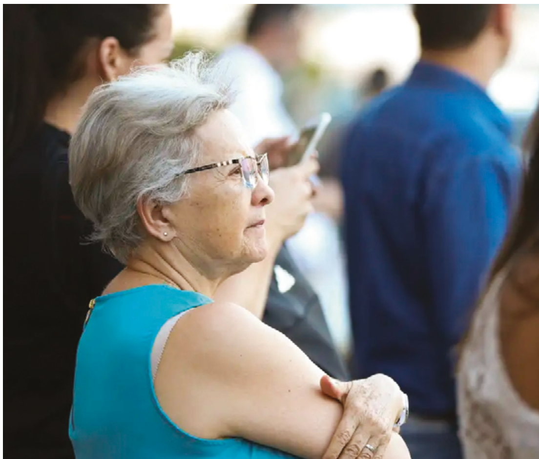
Um dos objetivos da proposta é contemplar a assistência integral ao idoso, considerando suas necessidades específicas

O Instituto de Medicina do Comportamento Eurípedes Barsanulfo (INMCEB) tem uma equipe multiprofissional reúne diversos especialistas como, psiquiatras, psicólogos, terapeutas, enfermeiros, assistente sociais e demais profissionais, que atuam em parceria com o objetivo de desenvolver um tratamento individual e direcionado para os pacientes. (Com informações INMCEB)