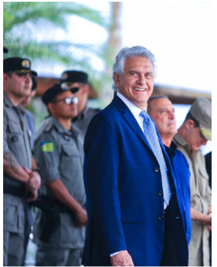
Governador Ronaldo Caiado em evento da Segurança Pública: maior redução ocorre com roubo de carga

As forças de segurança recuperaram 974 veículos com registro de furto ou roubo. As polícias Civil e Militar efetuaram 7.352 prisões em flagrante. No combate ao crime, 1.158 armas de fogo foram apreendidas e 1.911 foragidos recapturados. Conforme a SSP, três toneladas de drogas foram retiradas de circulação.