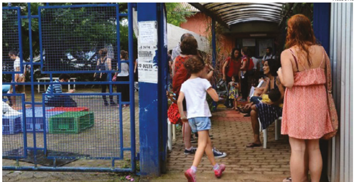
Observações da promotoria e do Gaepe/GO é para que filas sejam organizadas, criteriosas, transparentes e equânimes

O Gaepe-GO é uma governança horizontal que reúne gestores dos governos estadual e municipais, órgãos de