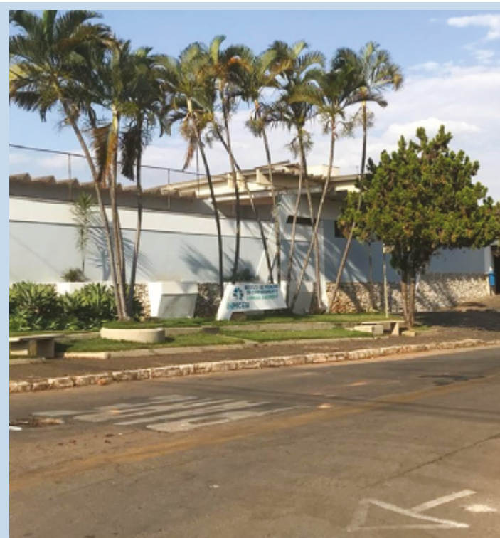
O INMCEB de Anápolis tem uma unidade de pronto atendimento 24 horas por dia e funciona na Rua Alan Kardec, 39, bairro Boa Vista

Em 2022, o total de pessoas com 65 anos ou mais no país (22.169.101) chegou a 10,9% da população, com alta de 57,4% frente a 2010, quando esse contingente era de 14.081.477, ou 7,4% da população. É o que revelam os resultados do universo da população do Brasil desagregada por idade e sexo, do Censo Demográfico 2022. No outro extremo da pirâmide etária, o percentual de crianças de até 14 anos de idade, que era de 38,2% em 1980, passou a 19,8% em 2022.