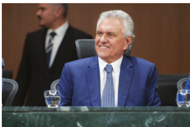
Ronaldo Caiado, segundo o levantamento, também apresenta o melhor saldo de avaliação, calculado pela diferença entre as menções positivas e as negativas

A pesquisa também apontou o saldo de avaliação, calculado pela diferença entre menções positivas e negativas, que cada gestor acumula. Novamente, Caiado é o mais bem avaliado. O governador de Goiás tem 70% de avaliação positiva e apenas