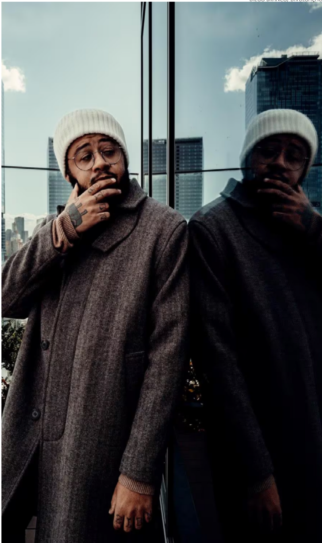
Emicida apresenta rimas cotidianas e acalentadoras na Arena Multiplace, em Goiânia

"O ápice dos gêneros passa. É efêmero. Mas os artistas que têm substância se mantêm. Eu acho que encontrei a linguagem da minha música, tenho me sentido instigado por esse exercício de criação", diz o artista, que acaba de lançar o single "Acabou, Mas Tem..."