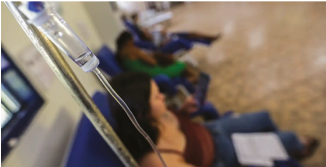
Esse ano, de dengue grave, os sorotipos que apareceram foram mais virulentos, com aumento dos casos de óbito

A médica reforça que ainda estamos vivenciando a epidemia de dengue e que a prevenção deve ser contínua. “Esse ano, em especial, de dengue grave, os sorotipos que apareceram foram bem virulentos, com