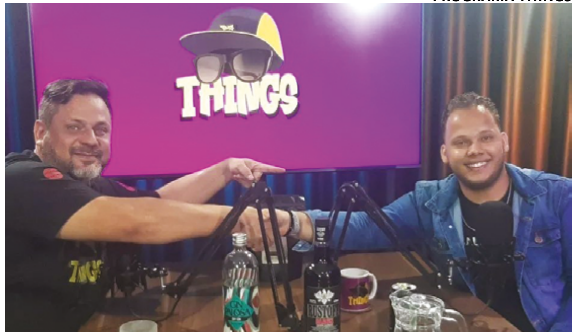
Programa Things, no YouTube e canal Studio Sigma