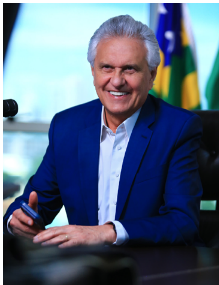
Ronaldo Caiado: governador mais bem avaliado do país

A pesquisa Genial/Quaest ouviu 1.127 eleitores em Goiás no período de 04 a 07 de abril. A coleta de dados foi realizada por meio de entrevistas face-a-face, por meio de aplicação de questionários estruturados. A margem de erro é de 2,9 pontos percentuais para mais ou para menos, e o nível de confiança é de 95%.