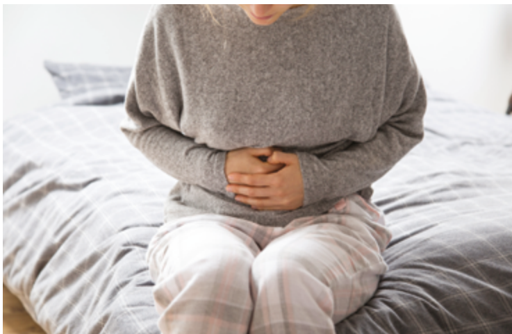
Entre os sintomas associados ao fluxo menstrual, para fins da lei: cólicas intensas, náuseas, vômitos, febre, dor nos seios (mastal-gia) e dor de cabeça

A comprovação desses sintomas deverá ser realizada por