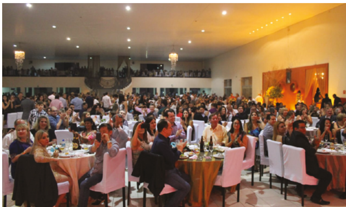
Após cinco anos, o tradicional baile está de volta para apoiar a educação especial e celebrar a amizade e a solidariedade

Após um intervalo de cinco anos, a APAE Anápolis anuncia com entusiasmo a volta do Baile da Amizade. Marcado para o dia 7 de junho, a partir das 21h, o evento é uma oportunidade para a comunidade se reunir em prol de uma causa nobre, celebrando a amizade e a so-