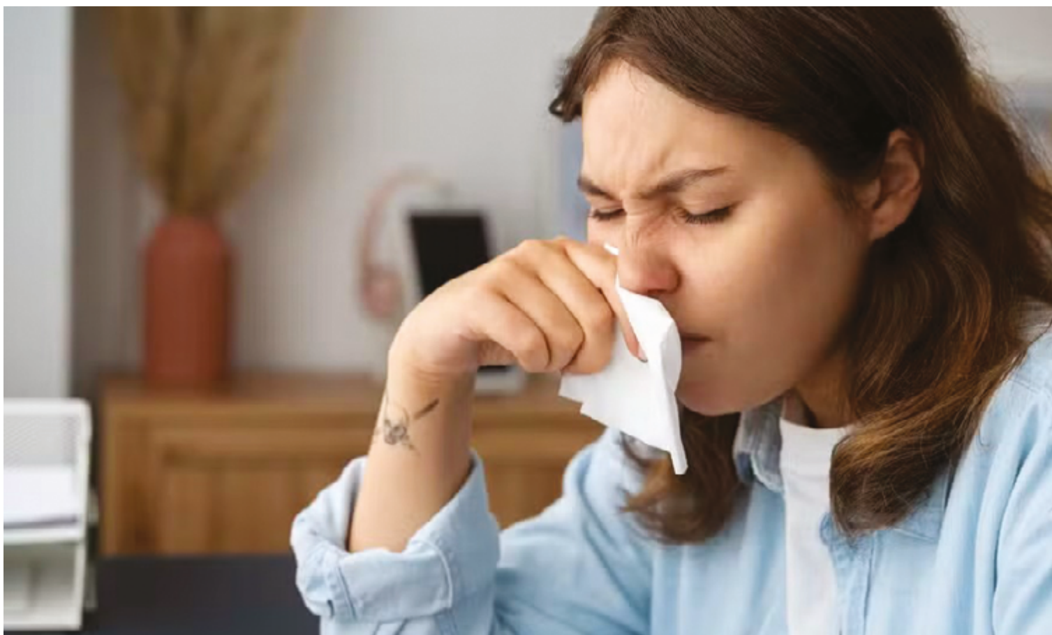
Pediatra explica que, neste período do ano, devido ao frio e à seca, surgem doenças respiratórias, como pneumonias, crises asmáticas e alergias

A baixa umidade é um fator conhecido por agravar os sintomas em crianças com doenças pulmonares preexistentes, como asma ou rinite alérgica. Entretanto, não é a única razão para o aumento do adoecimento das crianças nesta temporada. Outro fator significativo são os vírus, que tendem a circular mais facilmente e infectar um número maior de pessoas, devido às aglomerações em am-