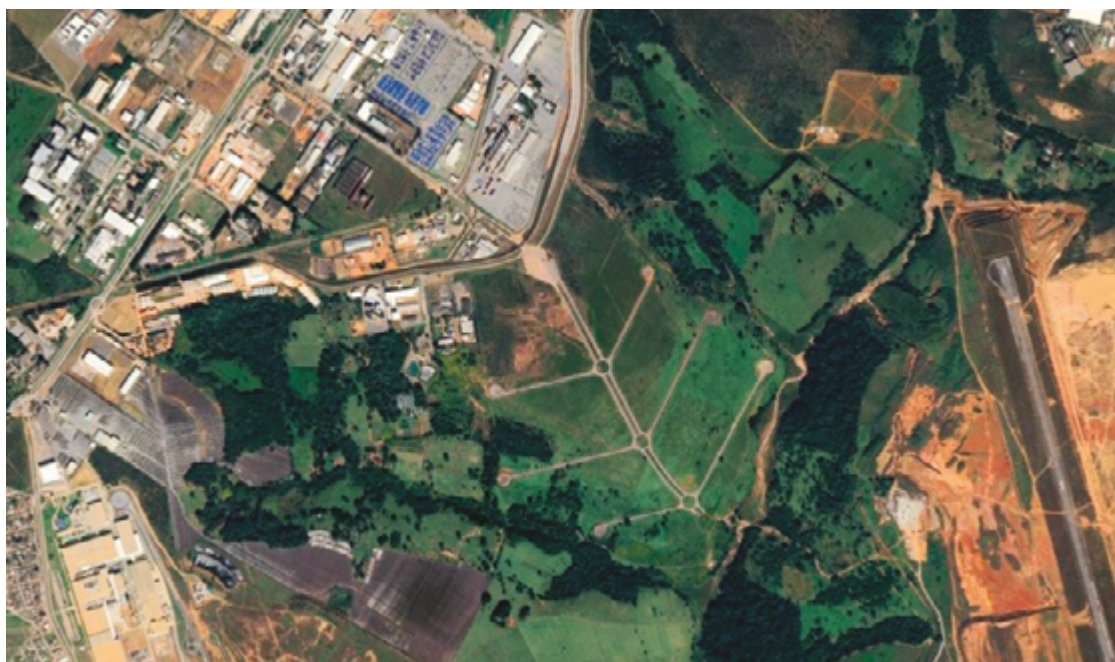
Governo de Goiás investe na infraestrutura Daia e busca expansão de 1,7 milhão de m² para atrair cerca de 100 empresas

O edital do DaiaPlam define os critérios de seleção das empresas que serão assentadas na nova área do Daia. O documento foi construído em parceria entre a Codego e a Secretaria de Estado da Infraestrutura (Seinfra) e contou com a participação da sociedade, por